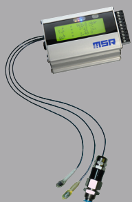
MSR 255 mit ext. Sensoren