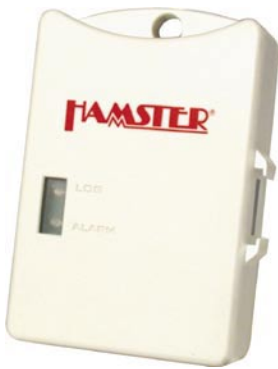
Hamster ET1 Hamster ET1-D